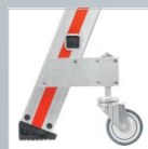
schwenkbare Rolle ohne Feststellbremse