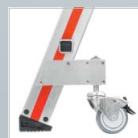
schwenkbare Rolle mit Feststellbremse